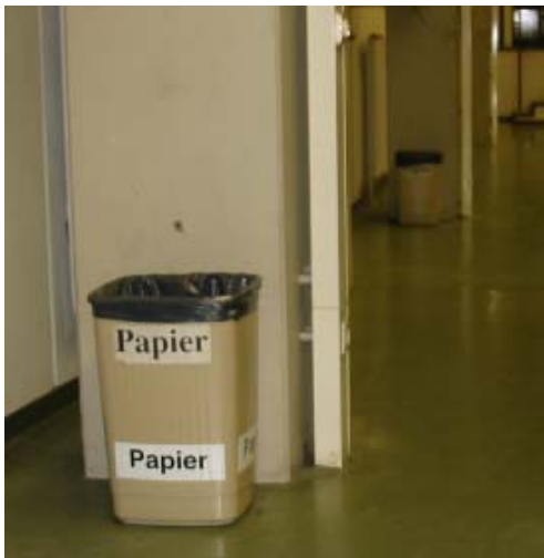
HSaF - unvollständiger Satz Mülleimer

Was macht Otto Normalstudent, wenn er eine Bananenschale in der Hand hat und beim Verlassen des Vorlesungssaals nur einen Mülleimer für Papier und einen für Wertstoffe mit Grünem Punkt sieht? Er schmeißt sie verständlicherweise wider besseren Wissens in einen der vorhandenen Mülleimer. Selbst für eifrige Mülltrenner ist es bisweilen schwer, den Abfall in die richtigen Behälter zu werfen, da die Reihe der Mülleimer selten vollständig ist. Außerdem machen schlecht lesbare Beschriftungen der Mülleimer das Trennen zu einem Mühsal, das viele nicht auf sich nehmen wollen.